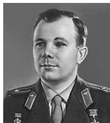
Ю. А. Гагарин