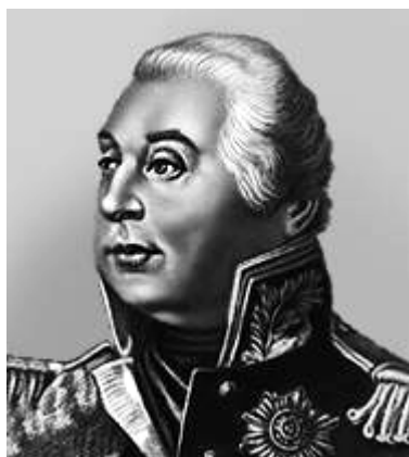
М. И. Кутузов