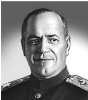
Г. К. Жуков