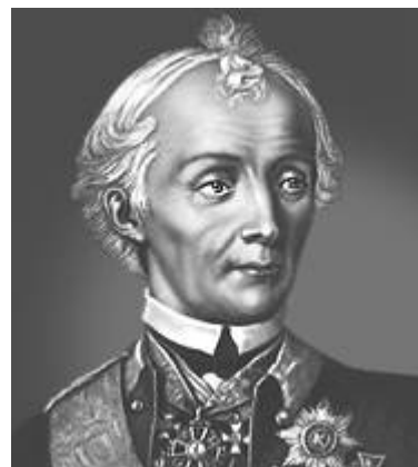
А. В. Суворов